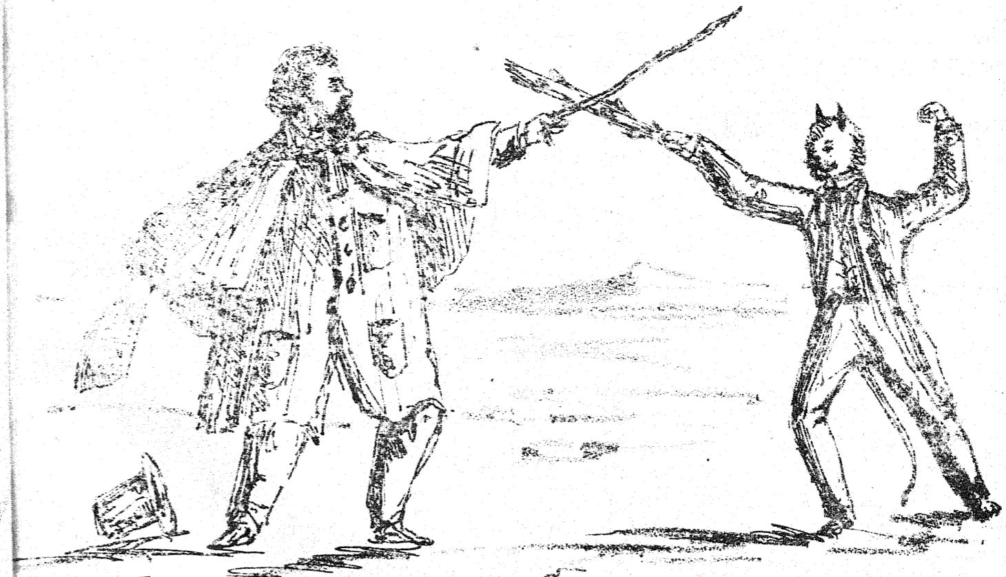
Garnotazo y tente tieso