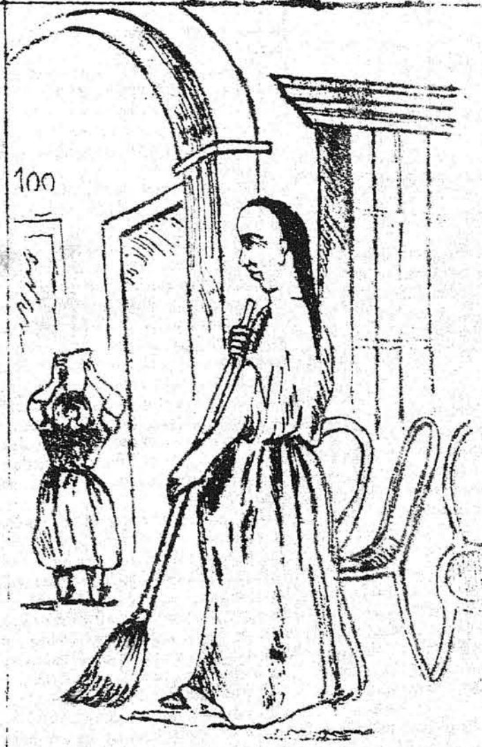
En mirratu y en casa.