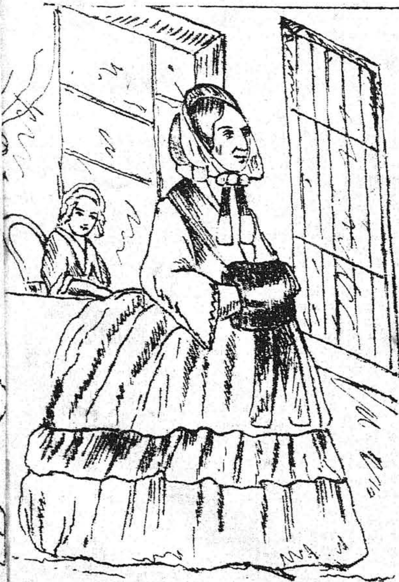
En mirratu y en la Calle.