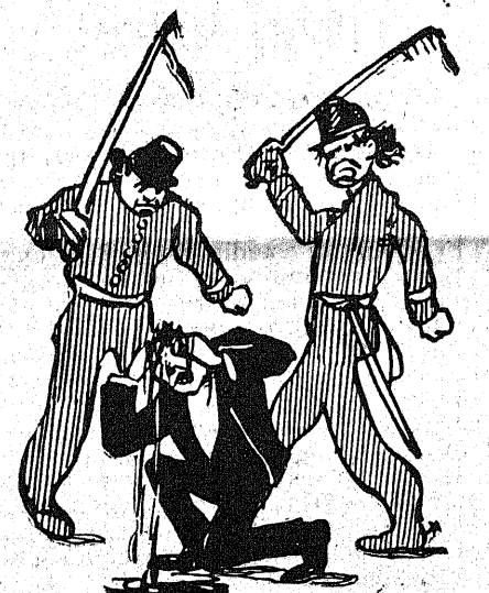
LOS SICARIOS EN ACCION

de estar terminantemente prohibidos los castigos corporales. Los encargados de hacer cumplir las leyes, son los primeros en violarlas, y los superiores callan y consenten los desmanes de sus subalternos. Es hora ya de que cesen esas infamias, esas vergüenzas impropias de un país que se dice marcha por el camino de la civilización.